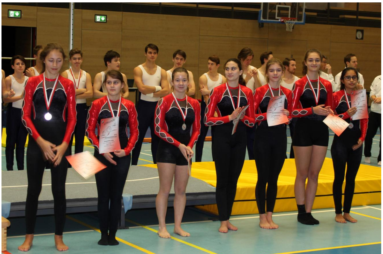
Gerätturnen w. (Plätze 4 bis 11) Jugend A/B