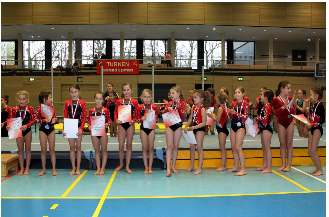
Gerätturnen w. (Plätze 4 bis 17) Schülerinnen E