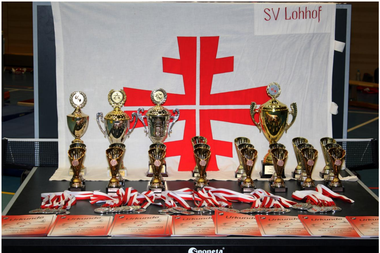
Tisch mit Pokalen, Medaillen und Urkunden für die zweite Siegerehrung